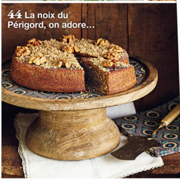
44 La noix du Périgord, on adore...