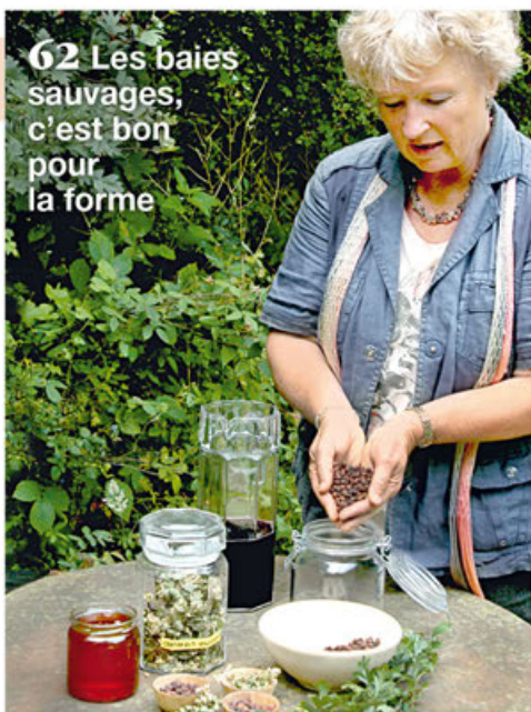
62 Les baies sauvages, c'est bon pour la forme