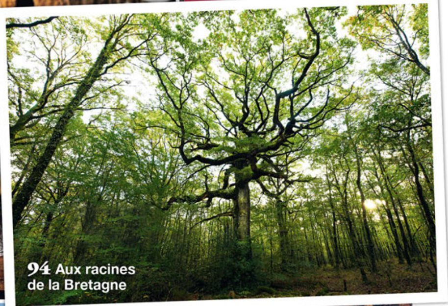
94 Aux racines de la Bretagne