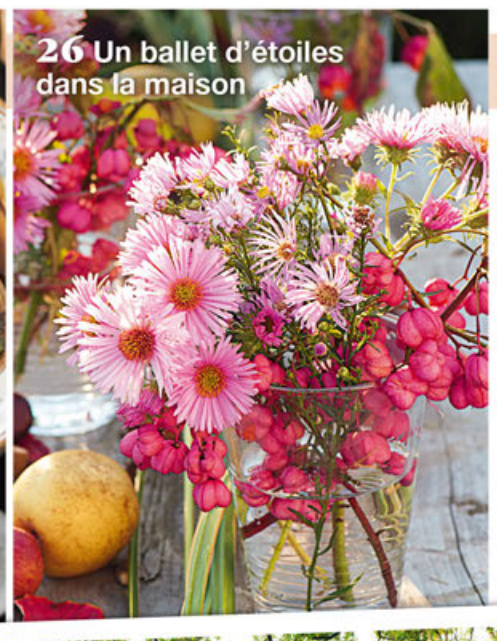
26 Un ballet d'étoiles dans la maison