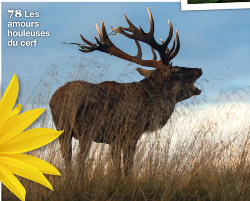
78 Les amours houleuses du cerf