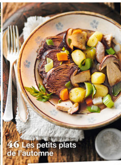
46 Les petits plats de l'automne