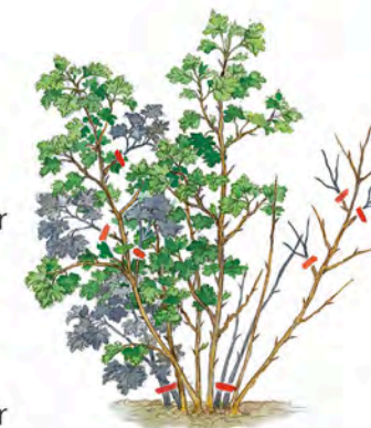
Le groseillier p. 36