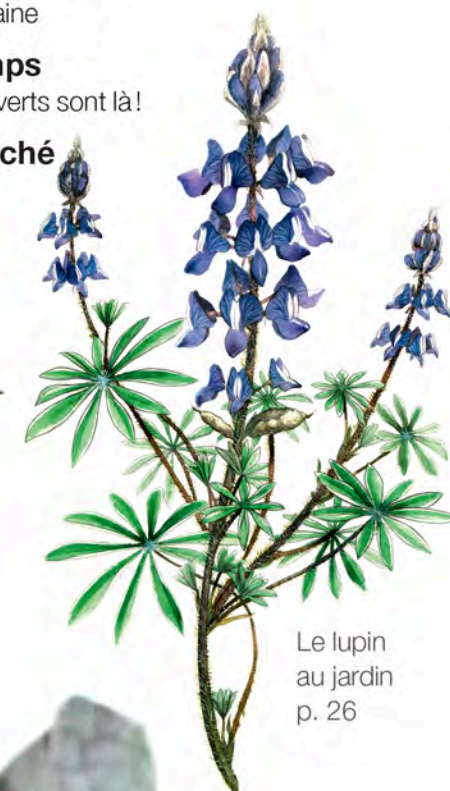
Le lupin au jardin p. 26