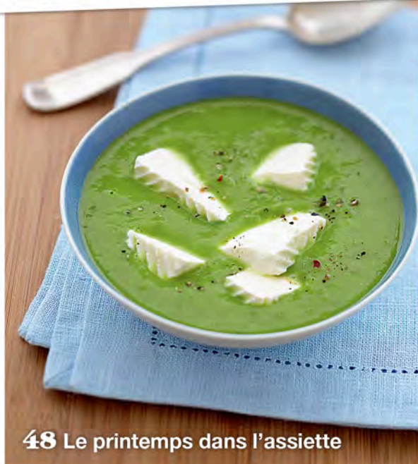
48 Le printemps dans l'assiette