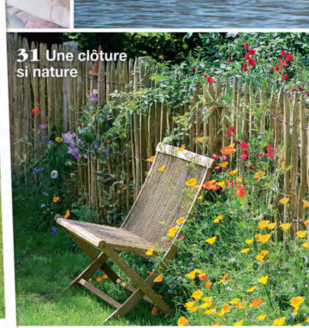
31 Une clôture si nature