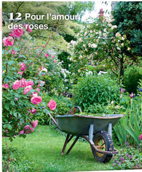
12 Pour l'amour des roses