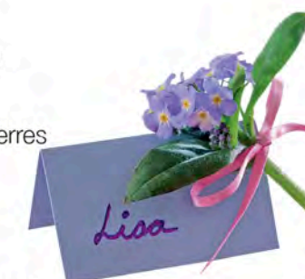
Le myosotis p. 18