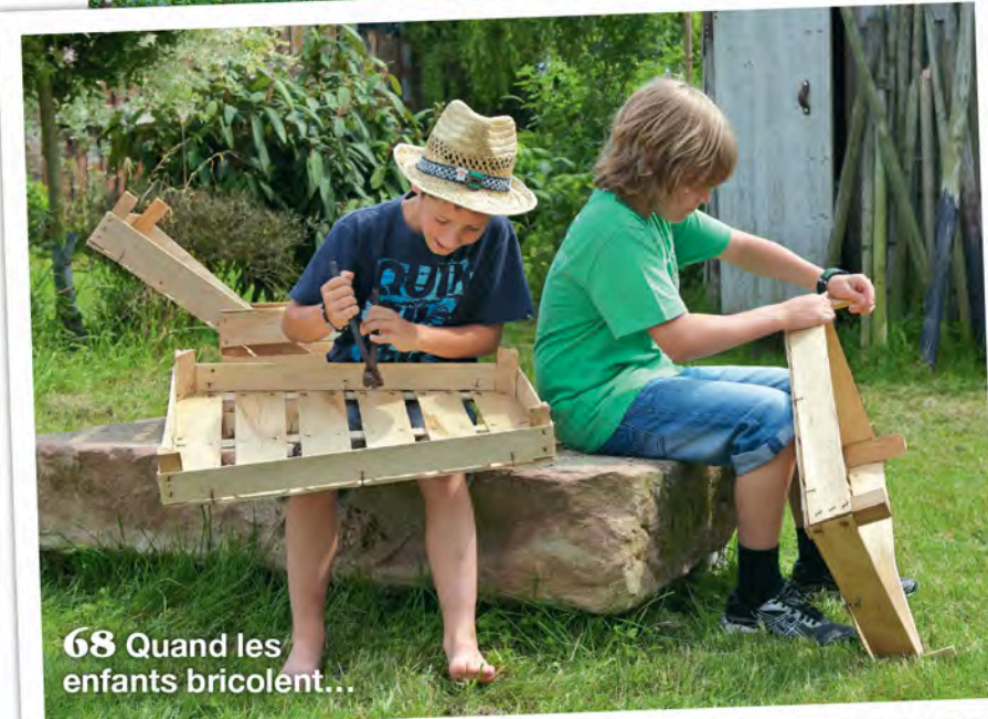
68 Quand les enfants bricolent...