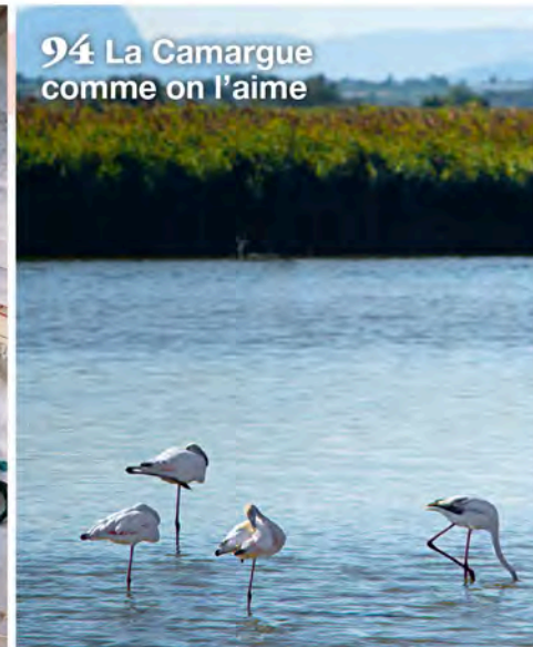
94 La Camargue comme on l'aime