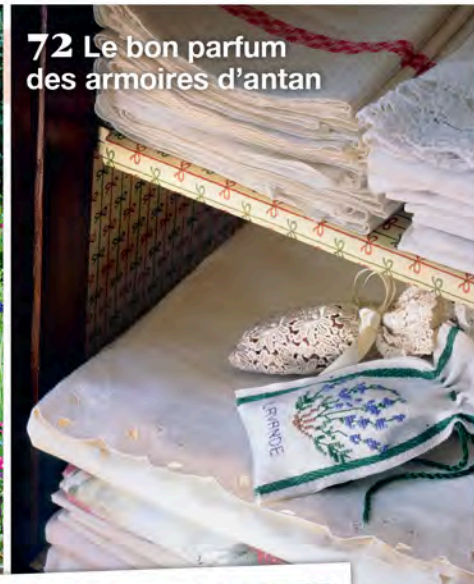
72 Le bon parfum des armoires d'antan