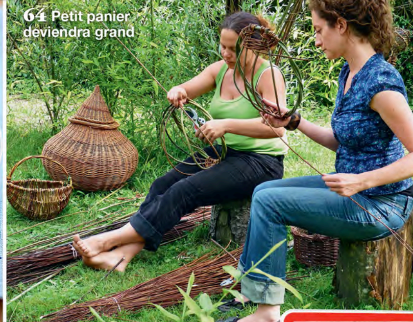
64 Petit panier deviendra grand