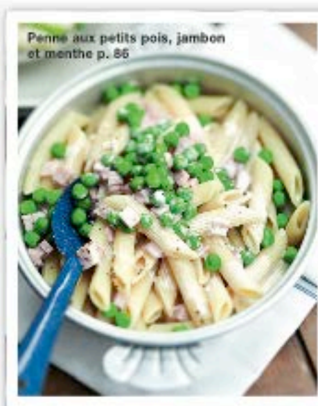
Penne aux petits pois, jambon et menthe p. 86