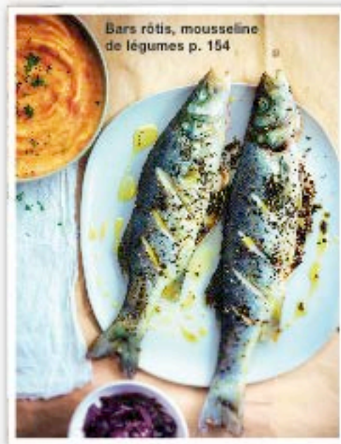
Bars rôtis, mousseline de légumes p. 154